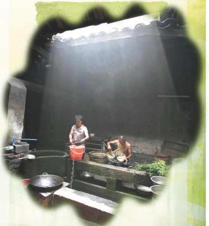
(2) ภาพประกอบจากอินเตอร์เน็ต "เทียนเจี้ยง" ลาน อเนกประสงค์ของคนฮากกา

เรื่องคิดถึงอาฟ่อ โดย วัฒนา ธรรมบัญญัติ ร่วมคิดถึงอาฟ่อและเขียน โดย อิชยา สกุลจารุสุทธิ